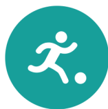
Spel en beweging / bewegingsonderwijs